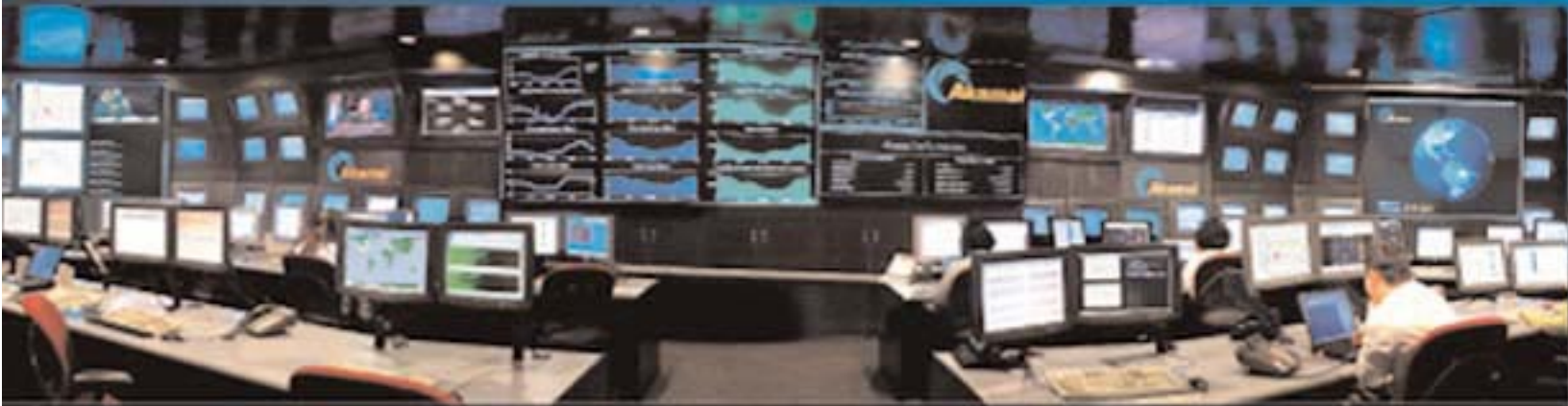
NOCC (Network Operations Command Center) d'Akamai